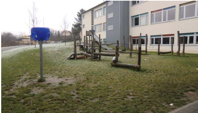
Spielplatz „Am Kleinfeldlein“

Anschaffung eines Spielgerätes auf dem Gelände der Freiherr-von-Lutz Grund- und Mittelschule; Spendenbeteiligung durch den Elternbeirat in Höhe von 2.500 €